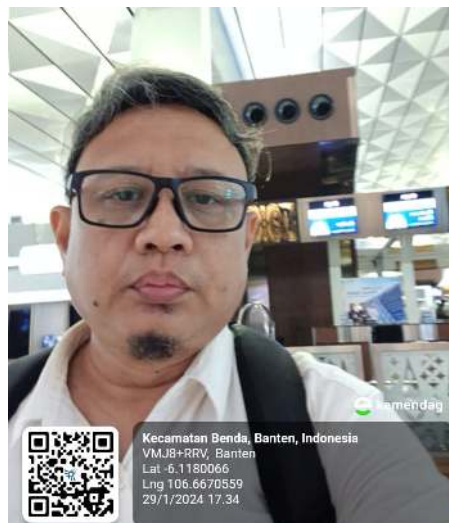
@Bandara Soeta (Perjalanan Pulang)