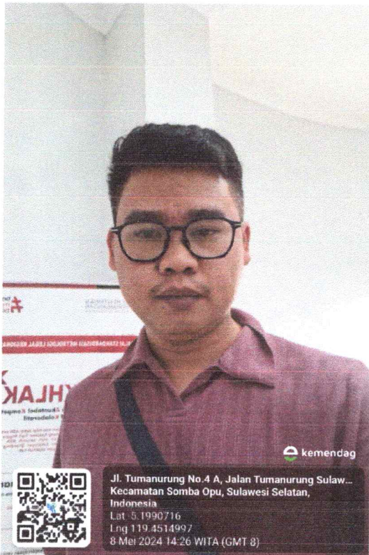
Jl. Tumanurung No.4 A, Jalan Tumanurung Sulaw... Kecamatan Somba Opu, Sulawesi Selatan, Indonesia Lat -5.1990716 Lng 119.4514997 8 Mei 2024 14:26 WITA (GMT 8)