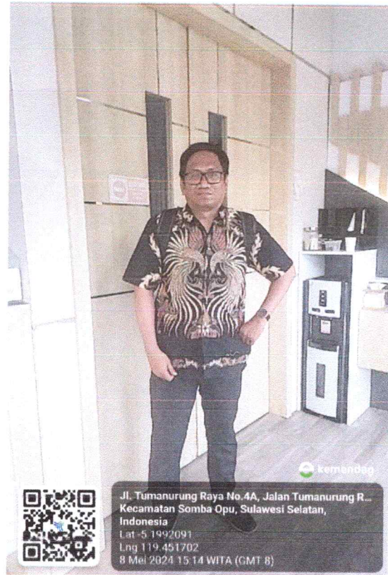
Jl. Tumanurung Raya No.4A, Jalan Tumanurung R... Kecamatan Somba Opu, Sulawesi Selatan, Indonesia Lat -5.1992091 Lng 119.451702 8 Mei 2024 15:14 WITA (GMT 8)