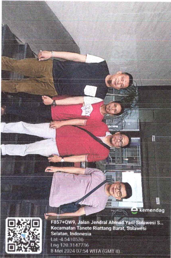
F857+QW9, Jalan Jendral Ahmad Yani Sulawesi S... Kecamatan Tanete Riattang Barat, Sulawesi Selatan, Indonesia Lat -4.5410536 Lng 120.3147736 8 Mei 2024 07:54 WITA (GMT 8)