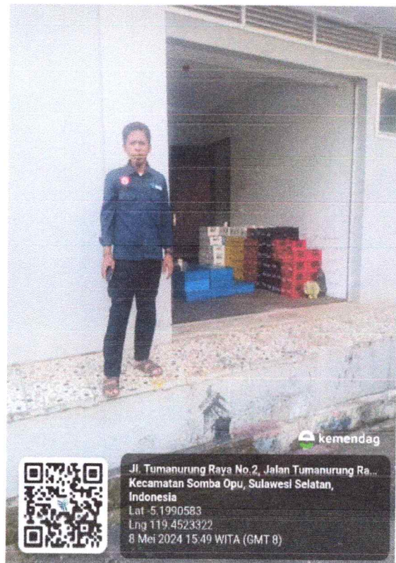
Jl. Tumanurung Raya No.2, Jalan Tumanurung Ra... Kecamatan Somba Opu, Sulawesi Selatan, Indonesia Lat -5.1990583 Lng 119.4523322 8 Mei 2024 15:49 WITA (GMT 8)